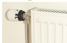
Heat & energy

Newspapers are delivered to paper recycling companies and then sent on to paper mills where they are turned into new paper.